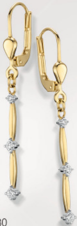
24-480 Ohrhänger Gold 333/- Zirkonia* 189,00