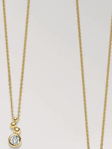
24-437 Anhängen o. Kette Gold 333/- Zirkonia* 119,00