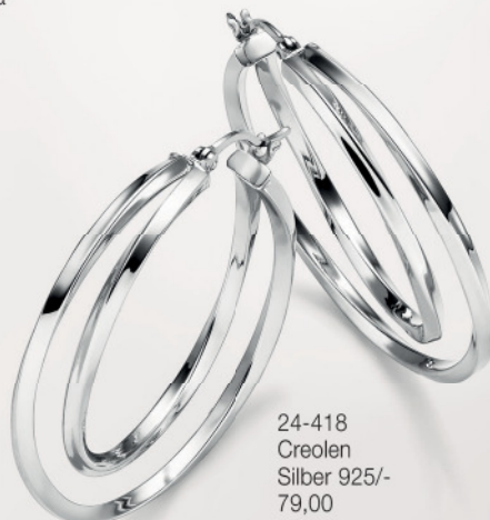
24-418 Creolen Silber 925/- 79,00