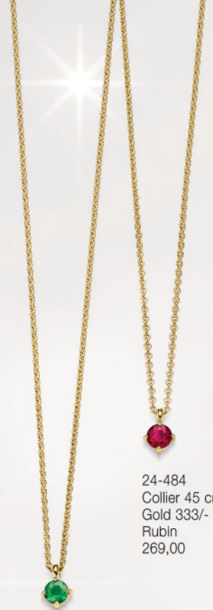
24-483 Collier 45 cm Gold 333/- Smaragd 269,00