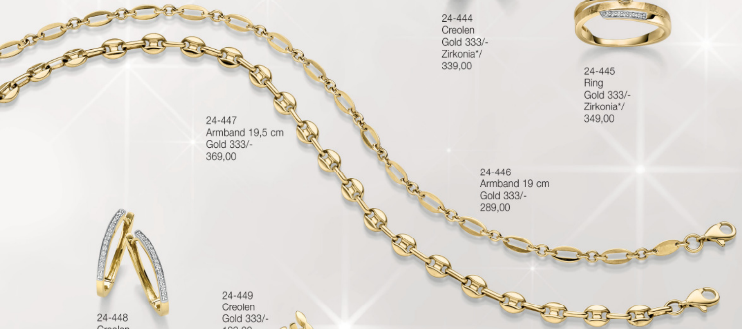
24-447 Armband 19,5 cm Gold 333/- 369,00