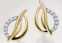
24-454 Ohrstecker Gold 333/- Zirkonia* 249,00