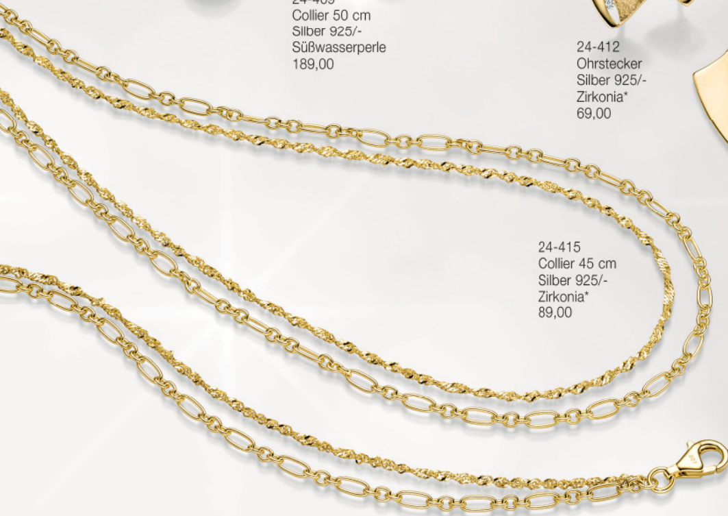
24-415 Collier 45 cm Silber 925/- Zirkonia* 89,00