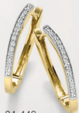
24-448 Creolen Gold 333/- Zirkonia* 349,00