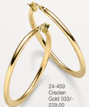
24-459 Creolen Gold 333/- 259,00