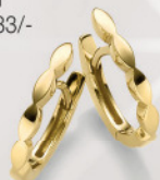
24-449 Creolen Gold 333/- 199,00