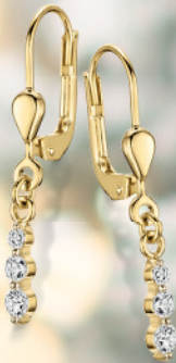
24-402 Ohrhänger Gold 333/- Zirkonia* 149,00