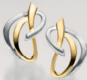
24-407 Ohrstecker Silber 925/- 65,00