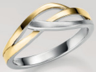
24-406 Ring Silber 925/- 69,00