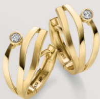
24-485 Creolen Gold 333/- Zirkonia* 289,00