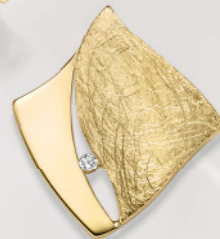
24-413 Anhänger Silber 925/- Zirkonia* 89,00