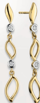
24-482 Ohrhänger Gold 333/- Zirkonia* 329,00