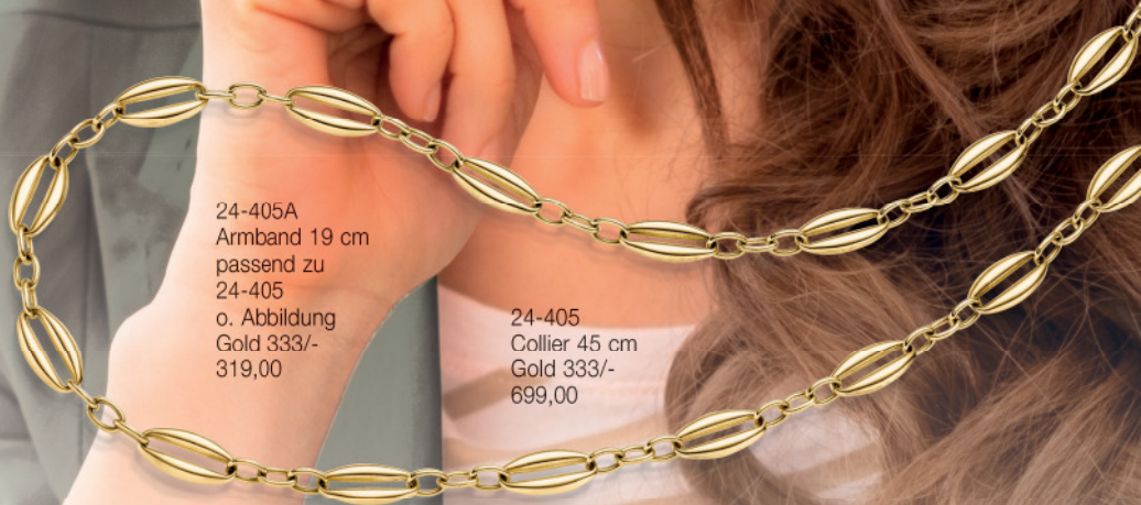
24-405A Armband 19 cm passend zu 24-405 o. Abbildung Gold 333/- 319,00