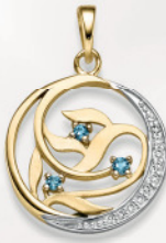
24-442 Anhängen Gold 333/- Zirkonia*/ Topas blau** 219,00