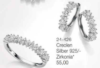
24-427 Ring Silber 925/- Zirkonia* 39,00