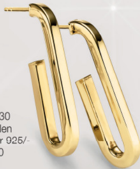
24-430 Creolen Silber 925/- 69,00