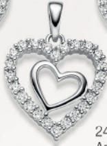
24-461 Anhängen Silber 925/- Zirkonia* 49,00