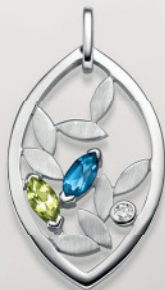
24-471 Anhängen Silber 925/- Zirkonia*/Topas blau**/ Peridot 99,00