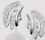
24-467 Ohrstecker Silber 925/- Zirkonia* 69,00