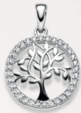
24-460 Anhängen Silber 925/- Zirkonia* 55,00