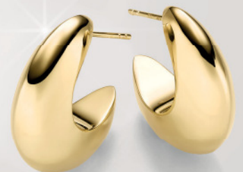
24-419 Creolen Silber 925/- 79,00