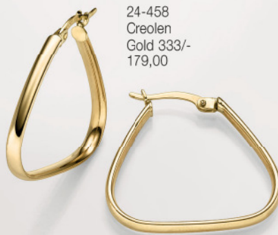
24-458 Creolen Gold 333/- 179,00