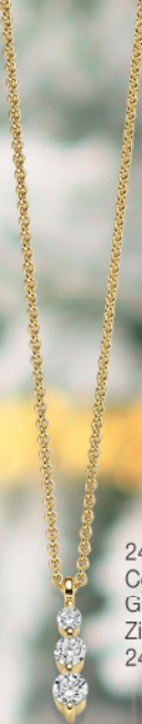
24-400 Collier 45 cm Gold 333/- Zirkonia* 249,00