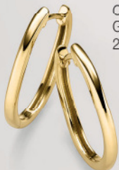
24-457 Creolen Gold 333/- 269,00