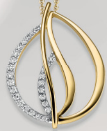
24-453 Anhänger o. Kette Gold 333/- Zirkonia* 319,00