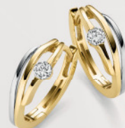
24-486 Creolen Gold 333/- Zirkonia* 229,00