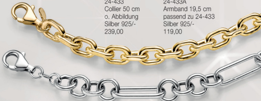
24-433A Armband 19,5 cm passend zu 24-433 Silber 925/- 119,00