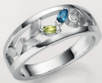
24-470 Ring Silber 925/- Zirkonia*/Topas blau**/Peridot 99,00