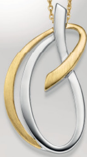
24-408 Anhänger o. Kette Silber 925/- 89,00