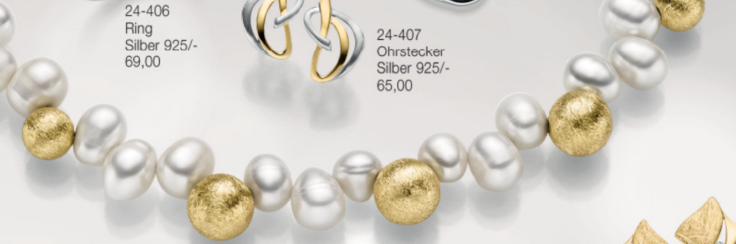
24-409 Collier 50 cm Silber 925/- Süßwasserperle 189,00