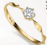
24-488 Ring Gold 333/- Zirkonia* 219,00