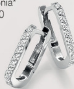
24-431 Creolen Silber 925/- Zirkonia* 49,00