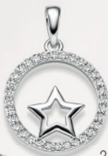
24-462 Anhängen Silber 925/- Zirkonia* 49,00