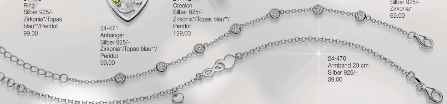
24-476 Armband 20 cm Silber 925/- 39,00