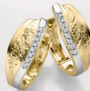
24-444 Creolen Gold 333/- Zirkonia*/ 339,00