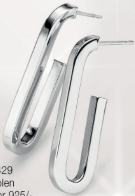
24-429 Creolen Silber 925/- 69,00