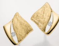
24-412 Ohrstecker Silber 925/- Zirkonia* 69,00