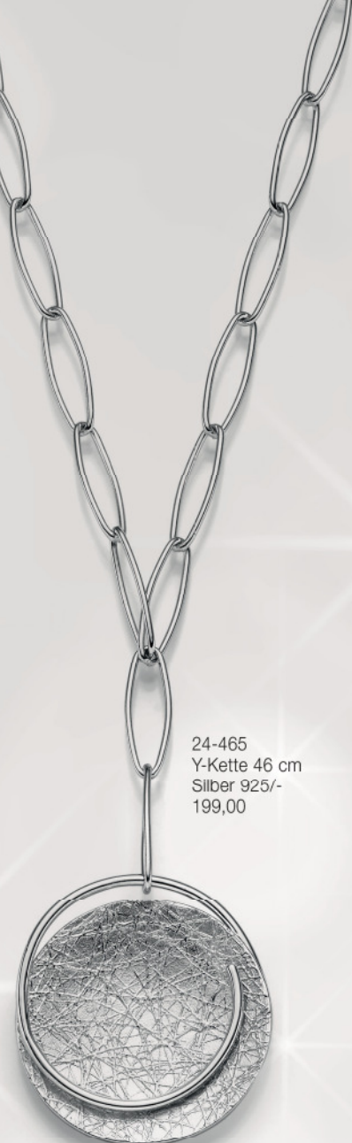
24-465 Y-Kette 46 cm Silber 925/- 199,00