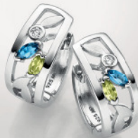
24-472 Creolen Silber 925/- Zirkonia*/Topas blau**/ Peridot 129,00