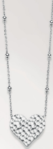
24-463 Collier 45 cm Silber 925/- 49,00