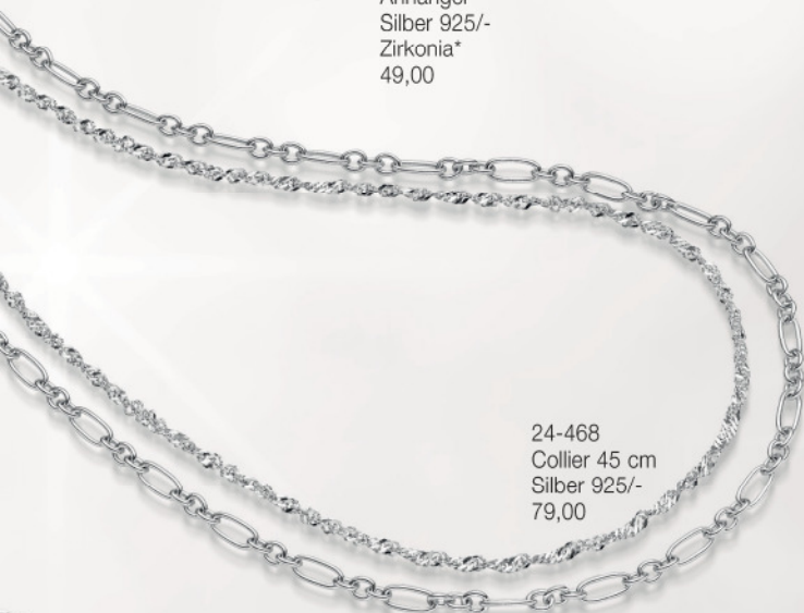
24-468 Collier 45 cm Silber 925/- 79,00