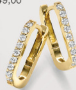
24-432 Creolen Silber 925/- Zirkonia* 49,00