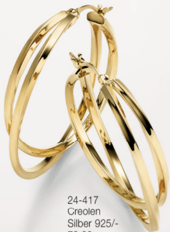
24-417 Creolen Silber 925/- 79,00