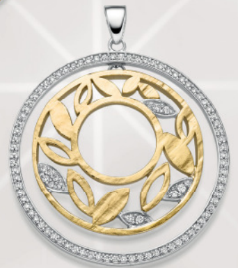
24-414 Anhänger Silber 925/- Zirkonia* 189,00