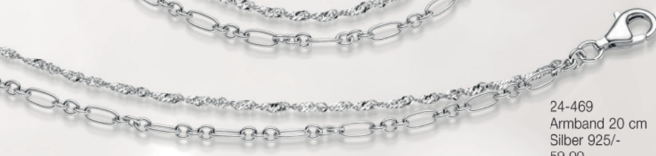
24-469 Armband 20 cm Silber 925/- 59,00