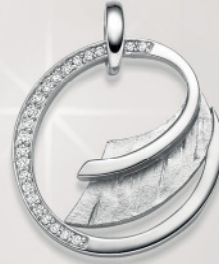
24-466 Anhängen Silber 925/- Zirkonia* 99,00