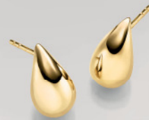
24-410 Ohrstecker Silber 925/- 79,00